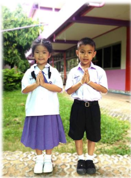
ลักษณะการแต่งกายชุดนักเรียนชาย-หญิง ระดับประถมศึกษา