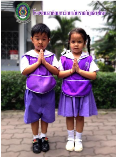
ลักษณะการแต่งกายชุดนักเรียนชาย-หญิง ระดับอนุบาล