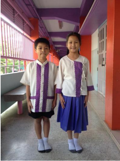
การแต่งกายชุดพื้นเมืองชาย-หญิง