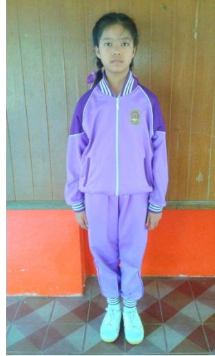
การแต่งกายชุดวอร์มประจำโรงเรียน