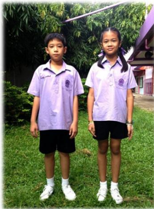
ลักษณะการแต่งกายชุดพลศึกษา ชาย - หญิง